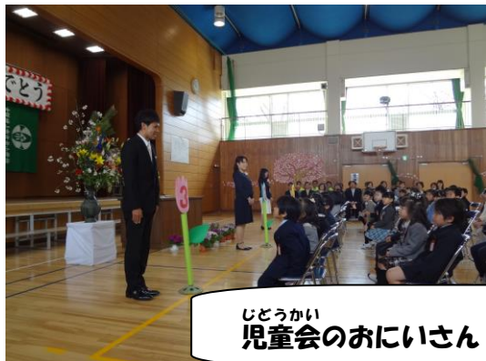
じどうかい 児童会のおにいさん・おねえさんが歓迎の劇を披露してくれました。

4月5日（金） しん1ねんせい にゅうがく 新1年生が入学しました。 みなし かりと みんなしっかりと話を聞くことができました。