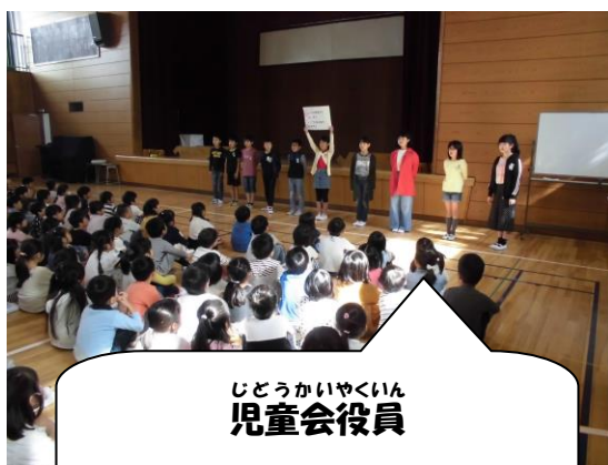
じどうかいやくいん 児童会役員