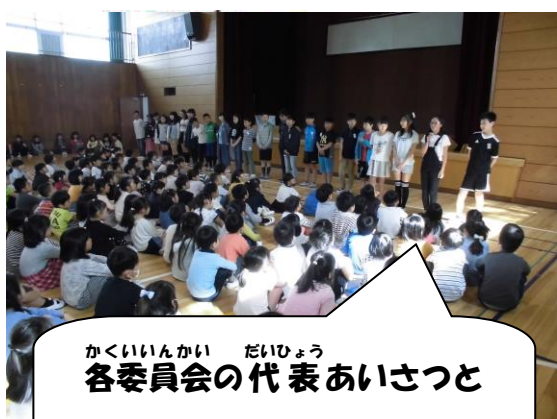
かくいいんかい だいひょう 各委員会の代表あいさつと

4月23日（火） じどうかいやくいん にんしょうしき 児童会役員の認証式を行いました。