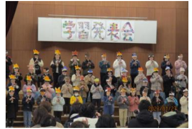
<3年生学習発表会の様子>

3学期がスタートして、書初めや、なわとび、サッカー、学習発表会の練習など、寒さに負けず様々な活動に一生懸命取り組んでいます。掃除の時間には冷たい水でぞうきんを絞り、長い廊下をきれいに拭いている子どもの様子も見られます。やるべきことを丁寧に、まじめに取り組む姿に子どもたちの成長を感じさせられます。