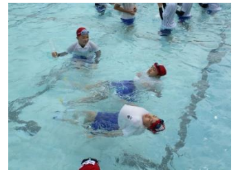
6年生 着衣泳の様子

夏休みは、今までの学習や生活を見直し、新学期に備え志を新たに準備する絶好のチャンスです。本日、担任からお渡しした「あゆみ」を見ていただき、たくさんがんばったことや楽しかったことを聞いてあげてください。そして、個人懇談会でお話させていただいたことや、5,6年生は先日返却した「すくすくウォッチ」の結果などから、得意とするところはどんどん伸ばし、少し苦手なところはどんな風に取り組んでいけばよいか