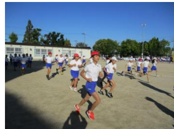
〈マラソン朝礼の様子〉

落ち葉の舞いに、冬の寒さをひととき感じる季節となりました。今学期も残すところ1ヶ月となりました。そのような中でも子どもたちは、マラソン朝礼で走ったり、休み時間のドッジボール大会に参加したりと元気に体を動かして活動しています。11月16日の土曜参観ではたくさんの保護者・地域の皆様にご参加いただきました。授業参観・引渡し訓練・オンライン授業(こども未来フォーラム視聴)と盛りだくさんでしたが、保護者・地域の皆様のご協力のおかげで、もしもの時を想定した動きを考える一日となりましたことに、心より感謝申し上げます。