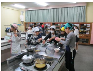
【5年 育てたお米で料理実習】